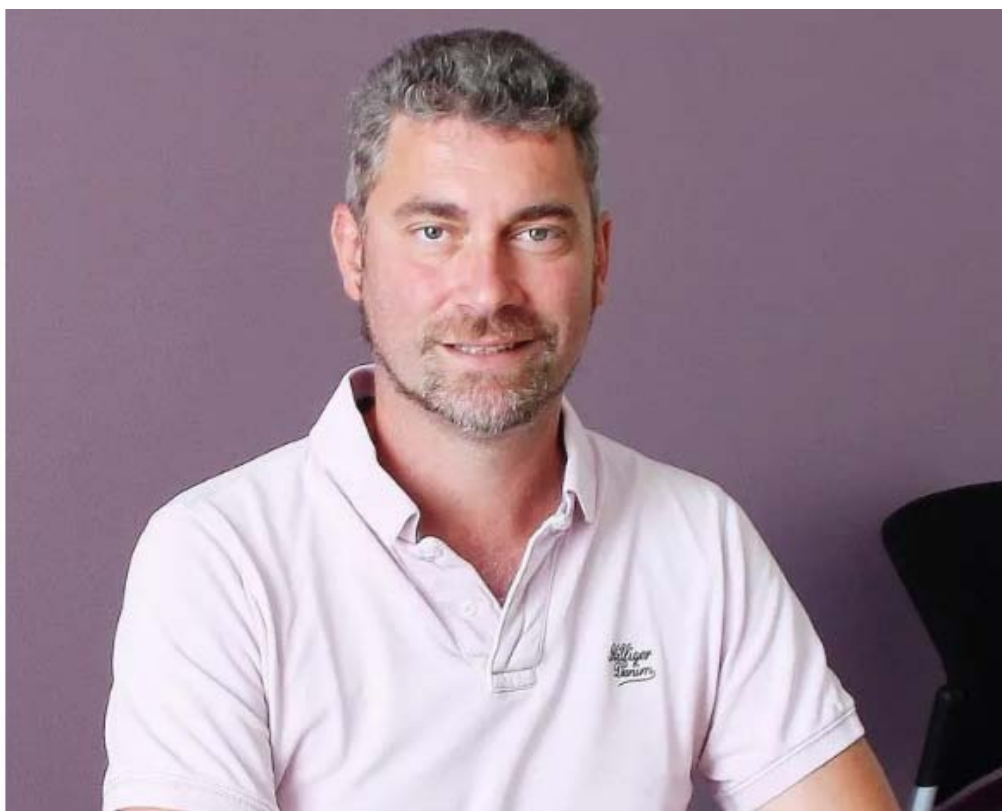
Yann a exercé cette même fonction à Mâcon.

À noter que les sacs jaunes et noirs, contrairement à ce qui se murmurait, sont encore d'actualité, les bacs en plastique n'étant pas à l'ordre du jour