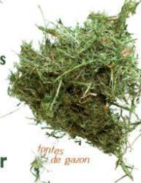
Tontes de gazon

Alors, pourquoi ne pas profiter de cette ressource ?