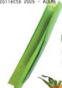
Filtres de thé