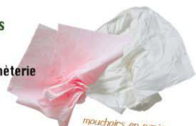
Mouchoirs en papier

Un sacré coût par ménage ! 6,85 milliards d'euros par an ! Ce sont les dépenses liées aux ordures ménagères.