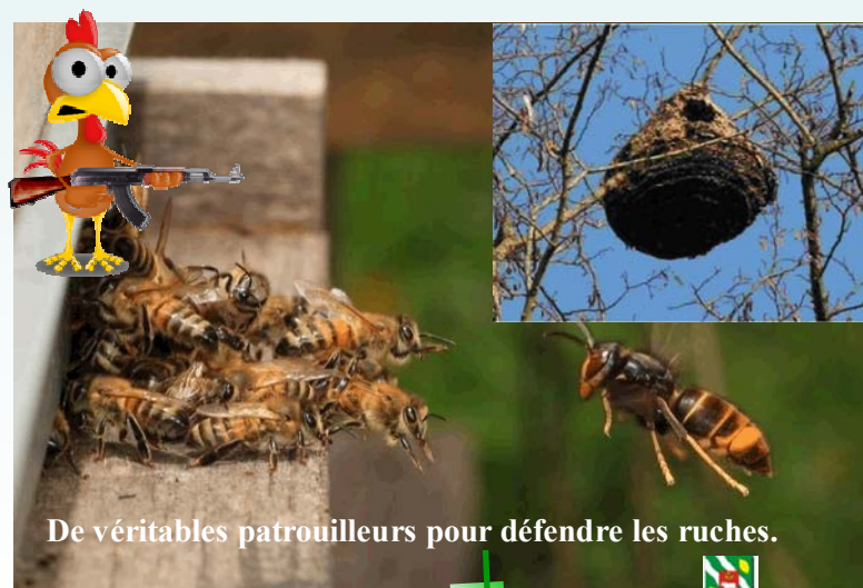
De véritables patrouilleurs pour défendre les ruches.

Cette solution naturelle et écologique pourrait bien faire des émules chez les apiculteurs, bien qu'il y ait des septiques pour casser cette idée originale.