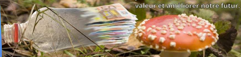
Le plastique, c'est toxique! Il se fragmente, provoque la mort des animaux et contamine la chaîne alimentaire.

Contribuons au ramassage et à la réduction de nos déchets. Recyclons-les pour leur donner une valeur et améliorer notre futur.